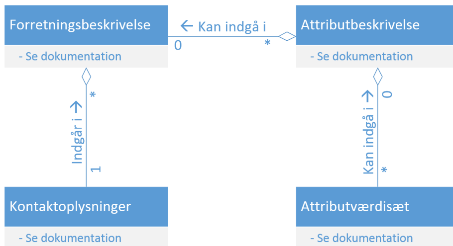
Figur 1: Informationsmodel for supplerende forretningsbeskrivelser.

Informationsmodellen for supplerende forretningsbeskrivelse er vist nedenfor uden attributter.